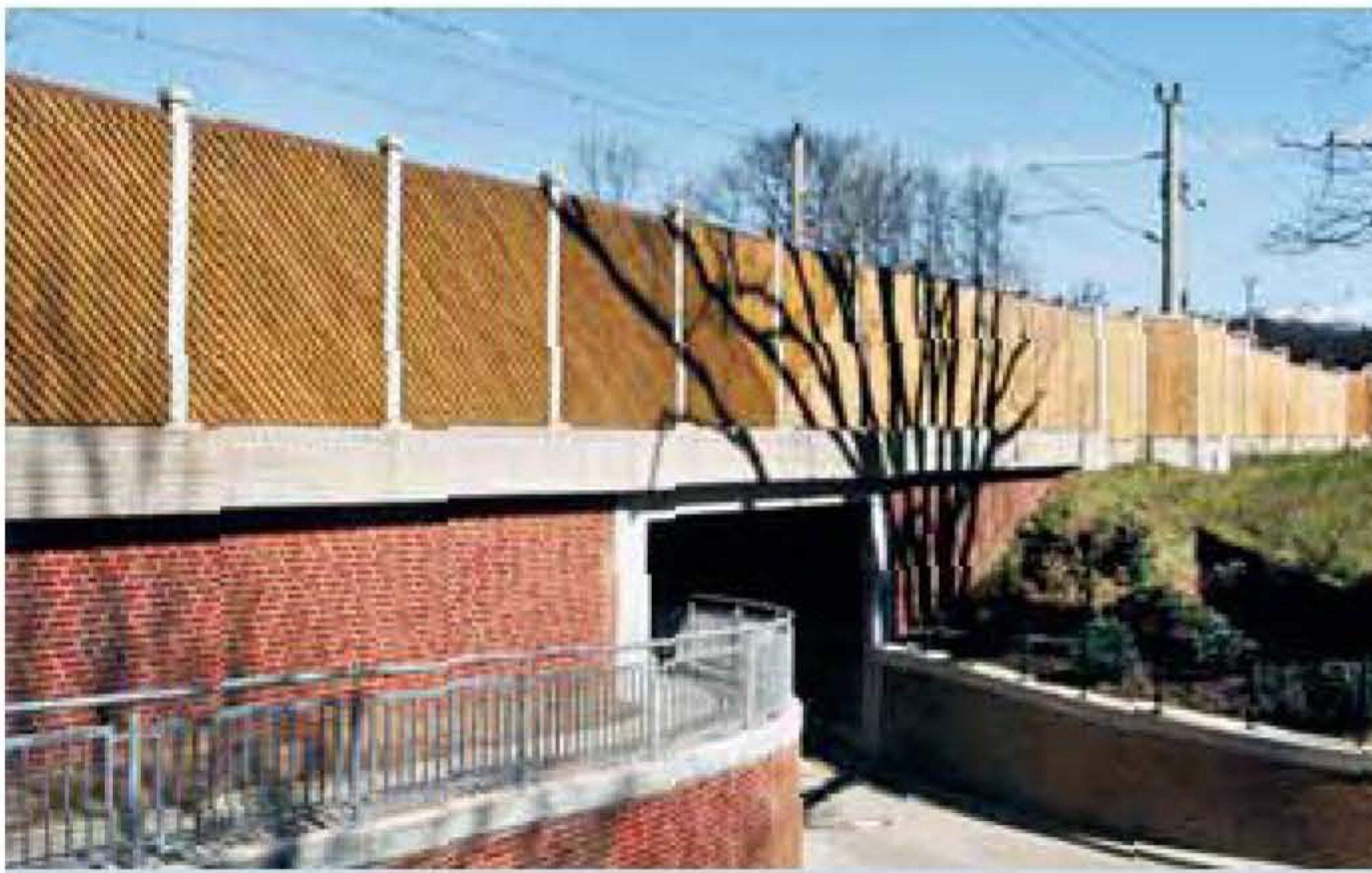
Deutsche Bahn · ICE-trase Hamburg – Berlin