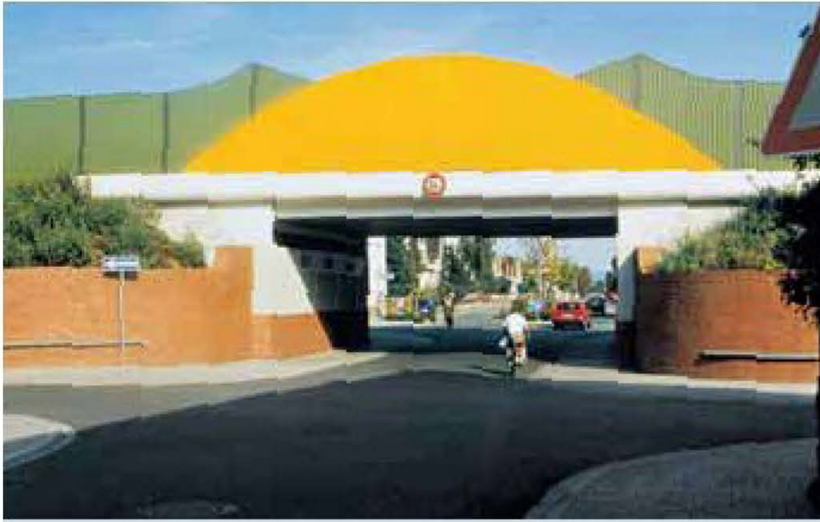
Automaģistrāle Frankfurt – Mannheim