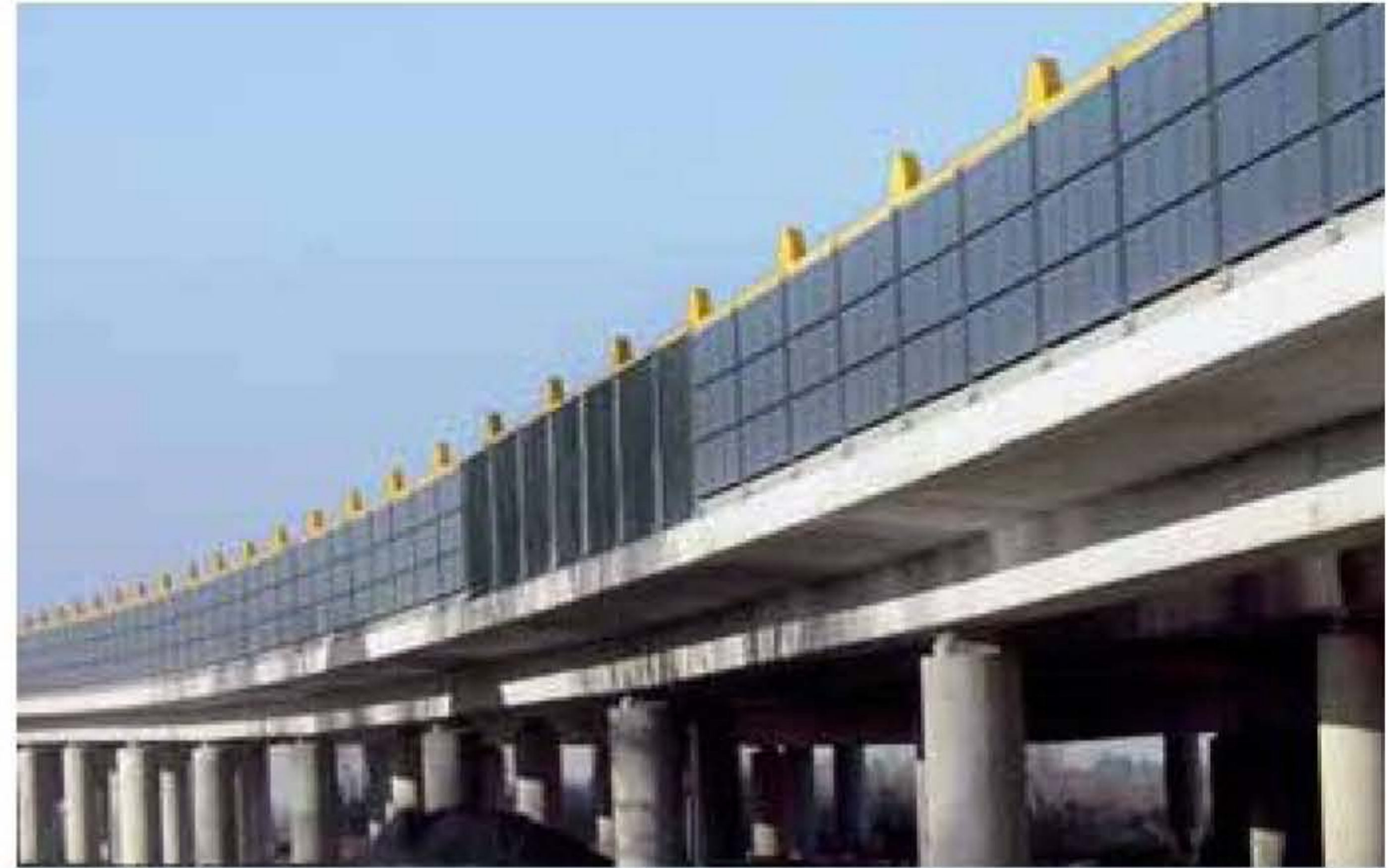
AB Emden · Vienas puses pārklājums ar Saules baterijas elementiem