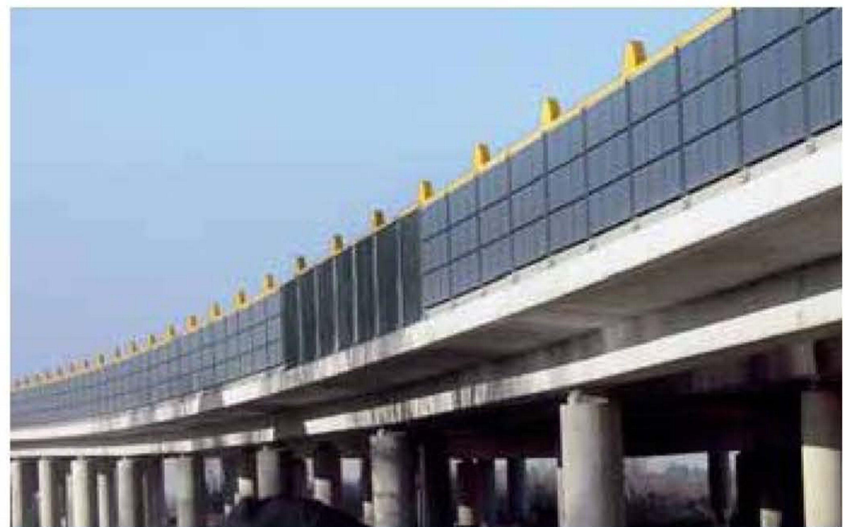
AB Emden · Viena sāna pārklājums ar Saules bateriju elementiem